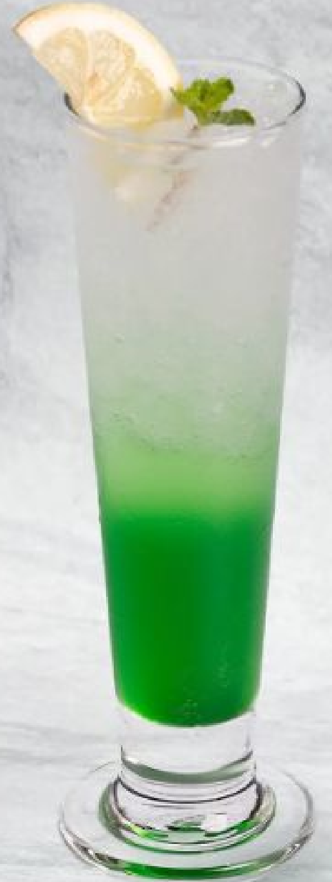
GREEN APPLE 青苹果